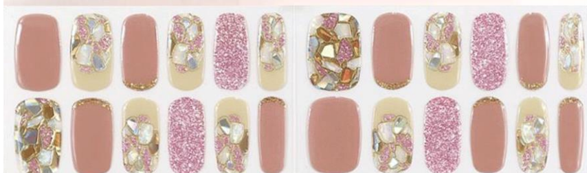
マダムバタフライ 1,650 円 (税込)