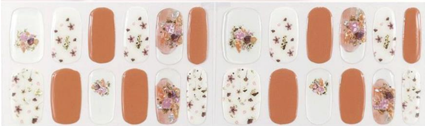
シャンドフルール 1,650円(税込)