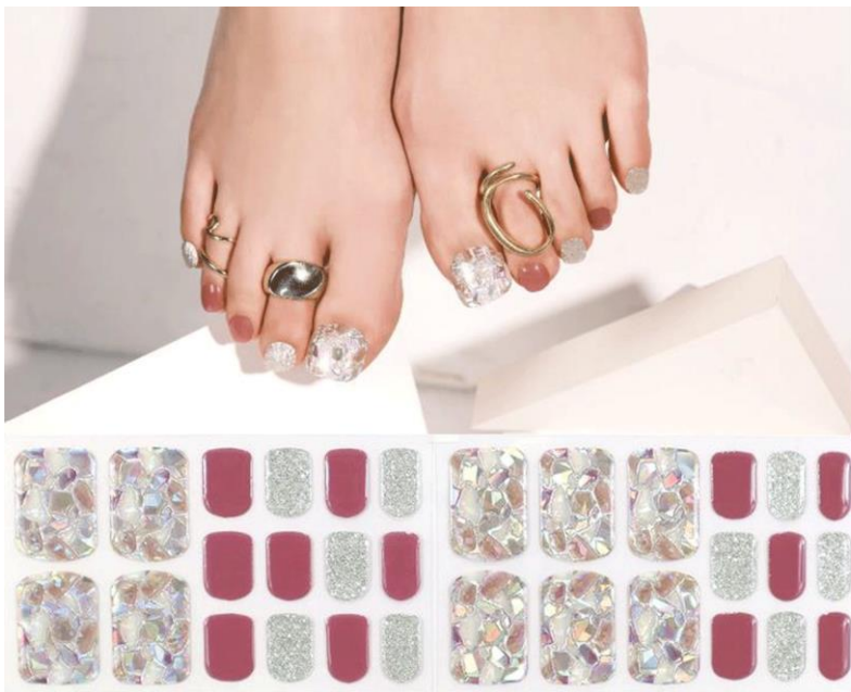
リスサクレ 1,650円(税込)