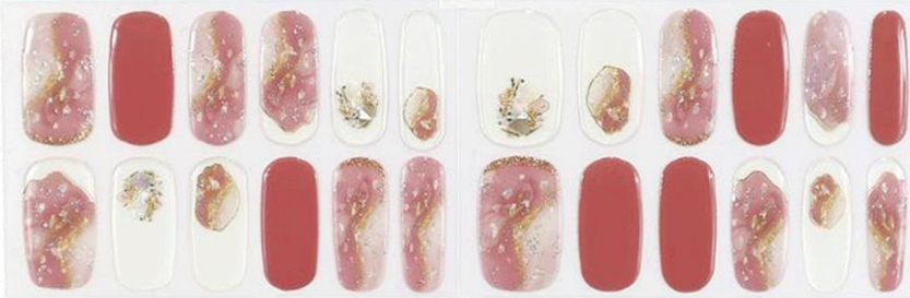
マリーボンボン 1,650円(税込)