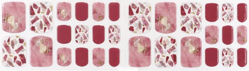
ムーランルージュ 1,650 円 (税込)