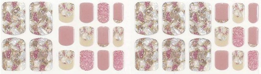
ローズコンフィダンシエル 1,650 円 (税込)