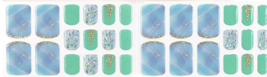
ジーンブルークレール 1,650 円 (税込)