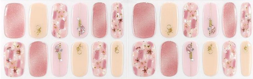
フルーレットエトワレ 1,650 円 (税込)