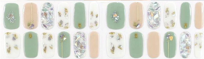
ジャンヌオルレアン 1,650 円 (税込)