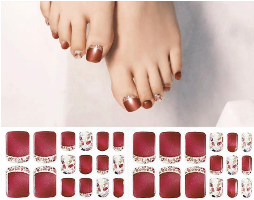
ルージュピラート 1,650円(税込)