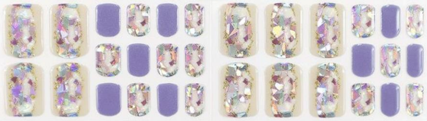
モーヴヴィヴァン 1,650 円 (税込)