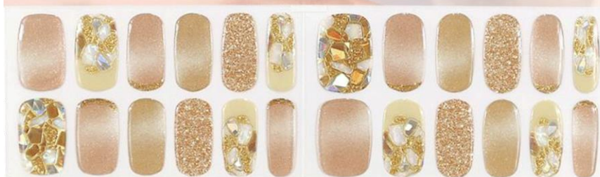
ミニヨンエクレール 1,650 円 (税込)